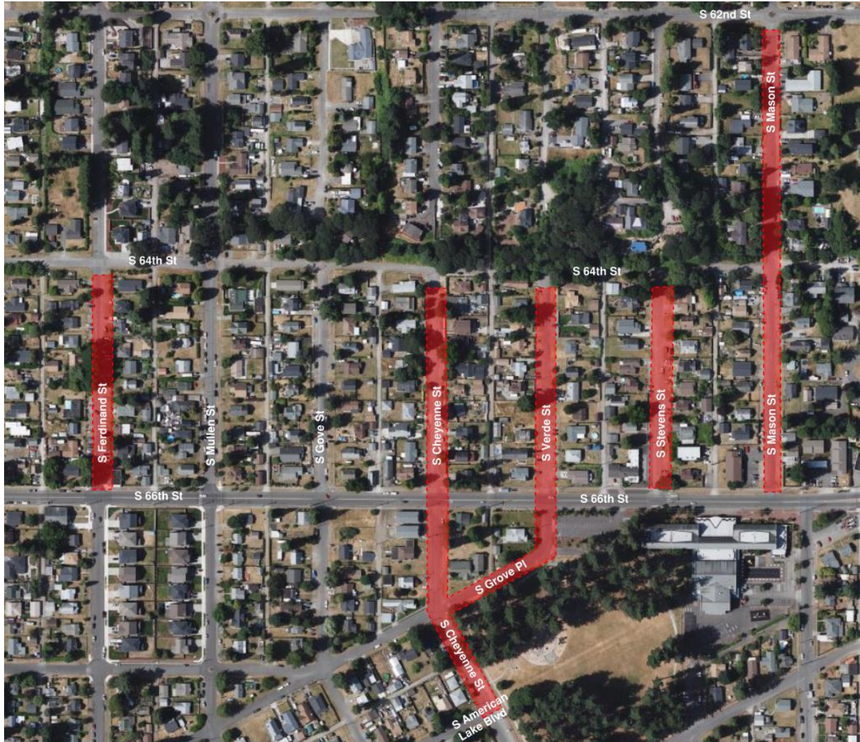
Hình 1-1: Bản đồ Vùng lân cận của Dự án

Dự án Cơ sở hạ tầng Xanh Manitou là một dự án thay thế đường và dịch vụ tiện ích sẽ thay các đường ống dẫn nước mưa, nước thải và nước sạch hiện có do đã cũ và xuống cấp. Ngoài thay thế các dịch vụ tiện ích, việc xây dựng lại toàn bộ con đường, bao gồm cả việc lắp đặt các dốc lề đường tuân thủ theo ADA tại nơi hiện có vỉa hè, sẽ được hoàn thành như một phần của dự án này. Hình 1-1 những chỗ đánh dấu màu đỏ là quy mô ước lượng của dự án.